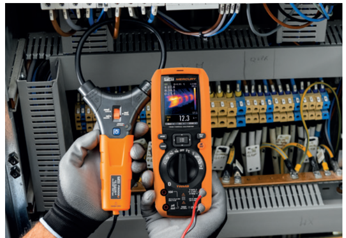
AC Strommessung mit flexiblem Wandler F3000U mit Wärmebildanzeige.