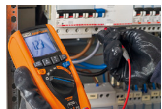
Drehfeldrichtung mit 1-phasiger Methode.