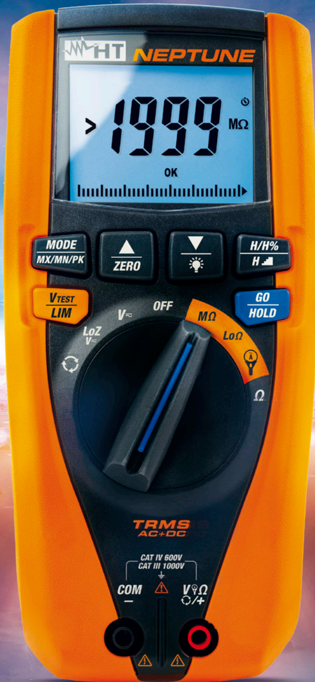
NEPTUNE Art.-Nr.: 1010830