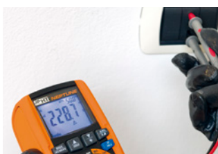
LoZ Funktion eliminiert Streuspannungen.