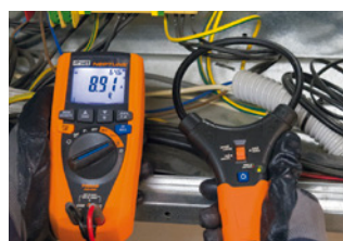
Messung des Stroms mit flexiblem Wandler.