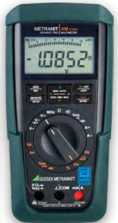
METRAHIT IAM XTRA