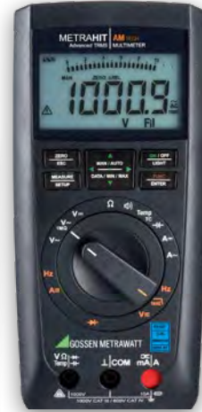
METRAHIT IAM TECH