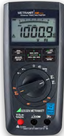
METRAHIT IAM BASE

Serienmäßig sichere und zuverlässige Multimeter für vielfältige Anwendungen