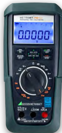
METRAHIT PM TECH