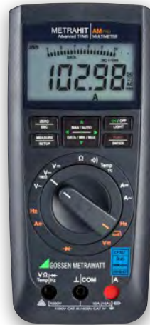
METRAHIT IAM PRO