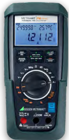
METRAHIT PM PRIME