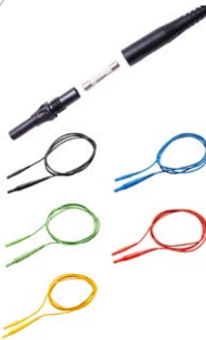
Messleitung 2 m mit Sicherung 10 A CAT IV 1000 V schwarz / blau / grün / rot / gelb WAPRZ002BLBBF10 WAPRZ002BUBBF10 WAPRZ002GRBBF10 WAPRZ002REBBF10 WAPRZ002YEBBF10