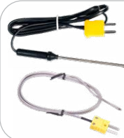
Temperaturmessung Sonde (Typ K, Bajonett) WASONTEMP Sonde (Typ K, Metall) WASONTEMK2