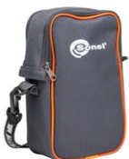
Tragtasche M13 WAFUTM13