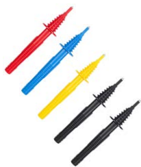
Spitzensonde (Banenstecker) rot / blau / gelb / schwarz B1 / schwarz B3 WASONREOGB1 WASONBUOGB1 WASONYEOGB1 WASONBLOGB1 WASONBLOGB3