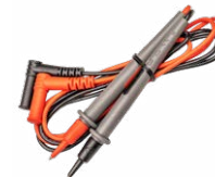
Satz Messleitungen CAT IV, S WAPRZCMM1