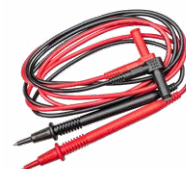
Satz Messleitungen für CMM/CMP WAPRZCMP1