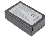
Akku Li-Pol 7,4 V 1200 mAh WAAKU30