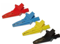
Krokodilklemme rot / blau / gelb / schwarz WAKRORE20K02 WAKROBU20K02 WAKROYE20K02 WAKROBL20K01